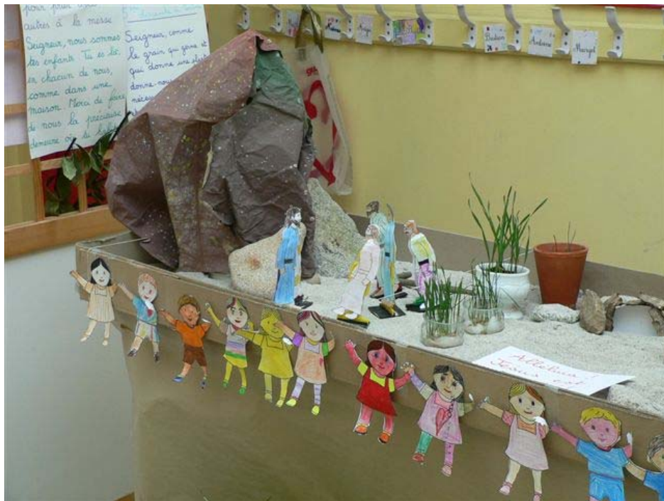
Ecole de l'Argoat-Sacré Cœur - Lesneven - CP Carême 2006