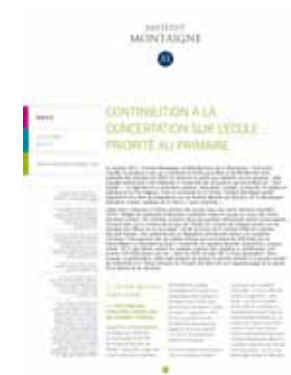
Contribution à la concertation sur l'école : priorité au primaire