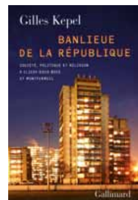
Banlieue de la République