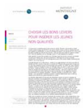
Choisir les bons leviers pour insérer les jeunes non qualifiés