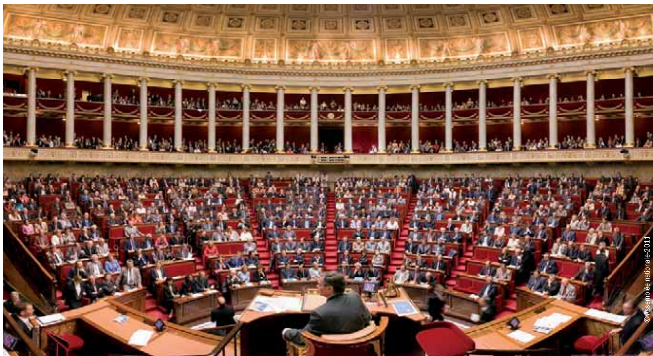
Hémicycle de l'Assemblée nationale lors de la séance d'ouverture de la XIII e législature (26 juin 2007).

Benoît Falaize , université de Cergy-Pontoise