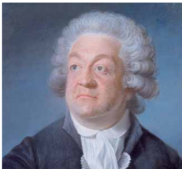
Honoré Gabriel Riqueti, comte de Mirabeau (1749-1791), homme politique français, écrivain et journaliste, portrait par Joseph Boze (1745-1826).

La Déclaration est l'œuvre collective de l'Assemblée constituante qui s'apprête à donner naissance à une monarchie constitutionnelle. Ses membres appartiennent pour l'essentiel à la bourgeoisie, à la noblesse et au bas clergé. Les débats ont été alimentés par de nombreux projets, dont ceux de Jean-Joseph Mounier (1758-1806), du marquis de La Fayette (1757-1834), de l'abbé Sieyès (1748-1836). Le texte présenté par le comte de Mirabeau (1749-1791), au nom d'un « Comité des cinq » chargé de faire la synthèse des projets, est rejeté le 18 août. Il inspire pourtant la rédaction de la Déclaration finale. Celle-ci est un texte de compromis, fruit de discussions parfois âpres.